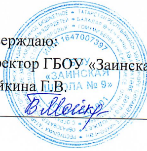
График проведения итоговой аттестации в 2025-2026 учебном году